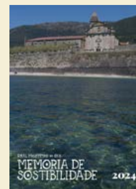
Memoria de Sostibilidade 2024