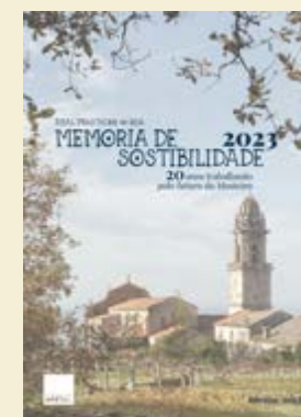
Memoria de Sostibilidade 2023