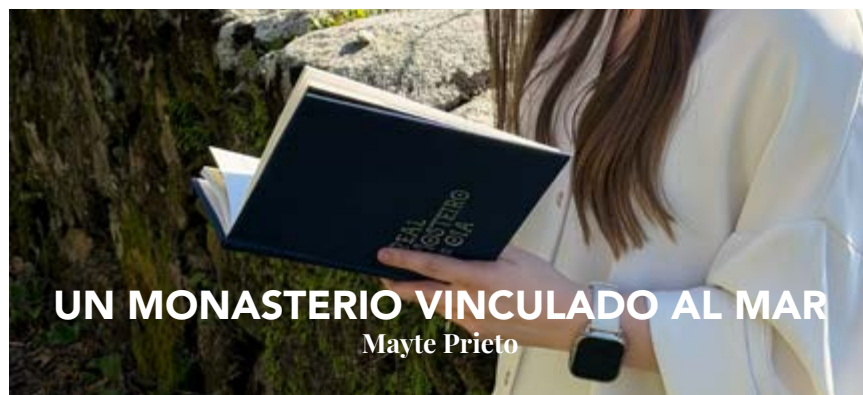
UN MONASTERIO VINCULADO AL MAR Mayte Prieto