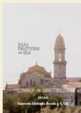
Memoria de Sostibilidade 2020