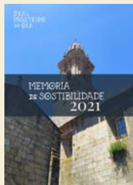
Memoria de Sostibilidade 2021