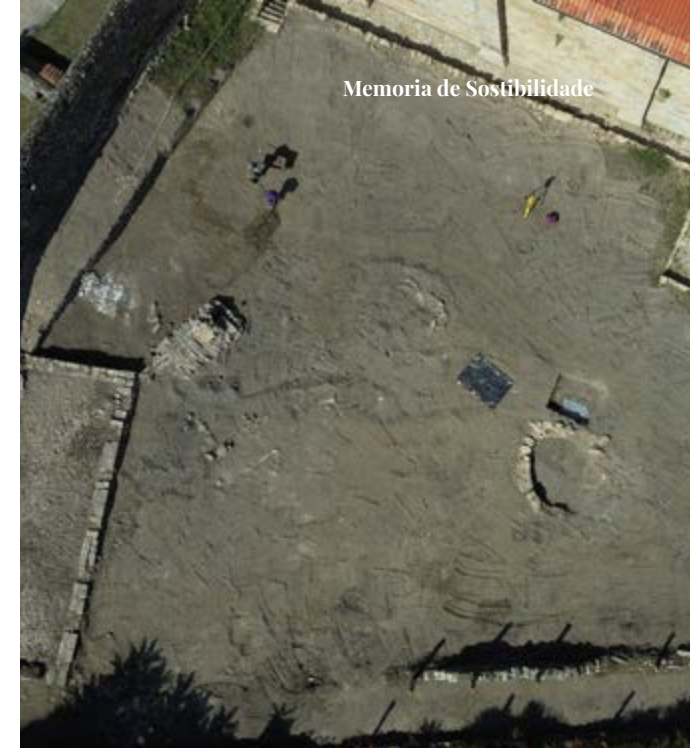
Estrutura circular achada no Patio dos Limoeiros previa á existencia do Mosteiro

O Mosteiro segue sendo, por tanto, un espazo vivo, no que a arqueoloxía, a historia e a divulgación avanza de forma conxunta , convertendo cada campaña de estudo nunha nova oportunidade para comprender, protexer e proxectar cara ao futuro este patrimonio excepcional.