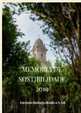
Memoria de Sostibilidade 2019

A consulta destas memorias permite apreciar a evolución das actuacións, os fitos alcanzados e a consolidación dun modelo de xestión baseado na sostibilidade, a investigación e a posta en valor do patrimonio.