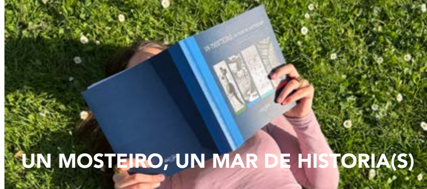
UN MOSTEIRO, UN MAR DE HISTORIA(S)