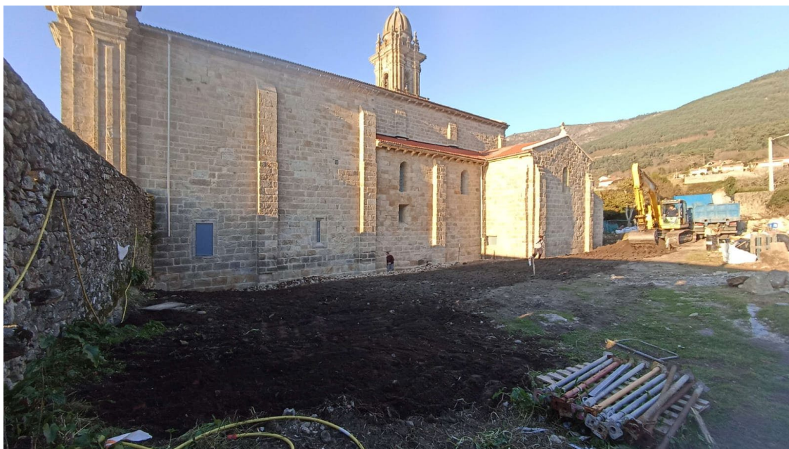
Patio de los Limoneros a diciembre de 2022

A consecuencia de ello gran parte del mencionado patio estuvo todo el año vallado, con lo que nuestros visitantes no pudieron admirar algunos de los lugares más especiales: la cabecera románica de la iglesia y durante el mes de agosto, además, la mitad del claustro renacentista. Otros trabajos en el Patio de Armas también debieron compatibilizarse con la actividad propia del Mosteiro constituyendo todo un desafío para nosotros.